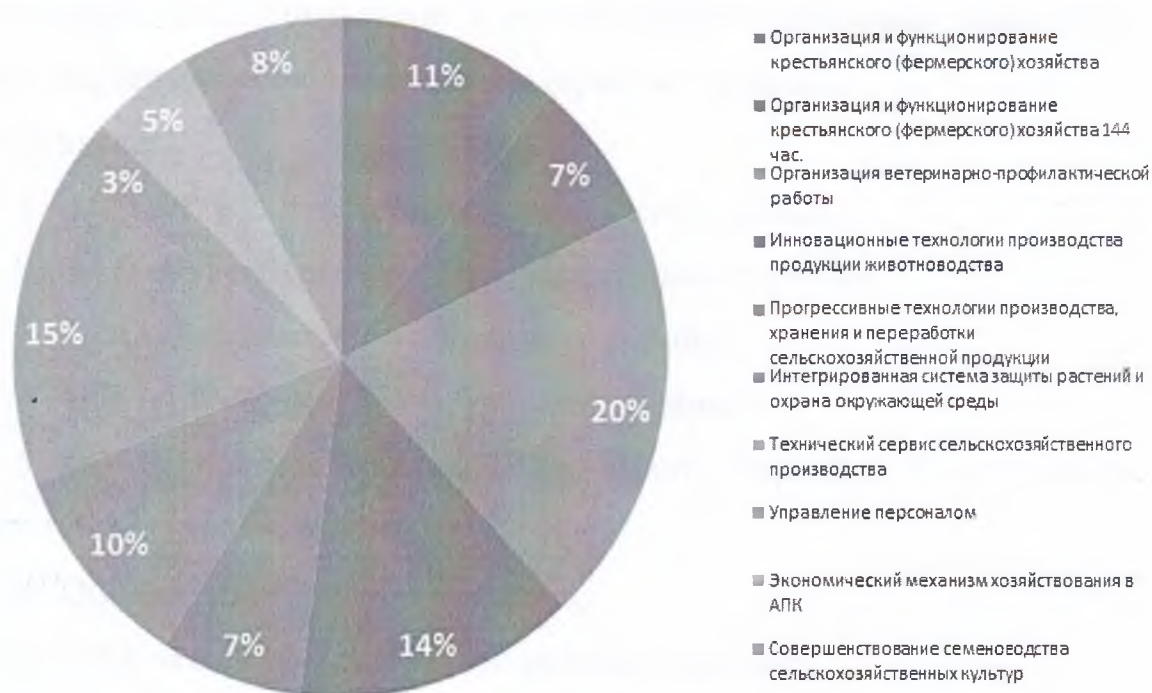
Рисунок 2 – Состав слушателей программ повышения квалификации за 2016 год