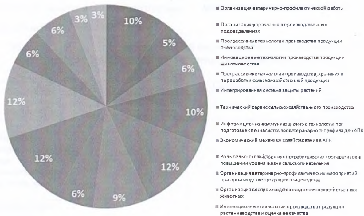
Рисунок 3 – Состав слушателей программ повышения квалификации за 2017 год

Учреждение изучает и знакомит руководителей и специалистов всех форм собственности с практикой и опытом работы передовых эффективно работающих сельскохозяйственных предприятий области.